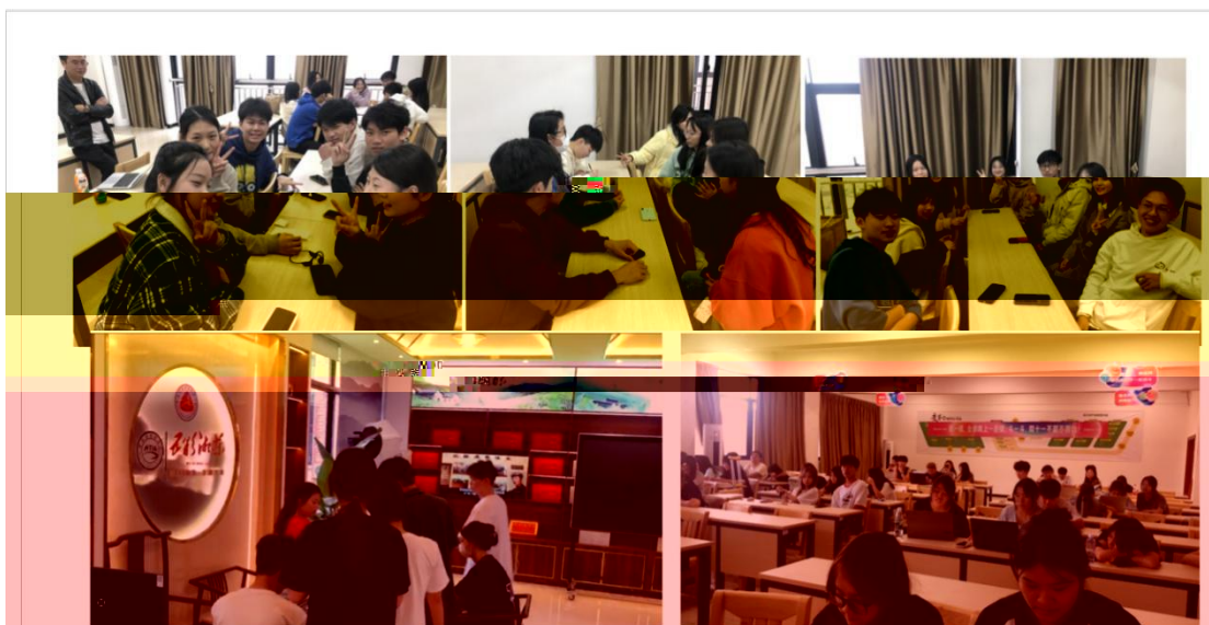
同学们在实训室进行课程学习