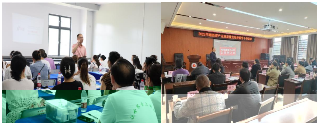
图 企业协助学校为湘西茶企开展电商直播培训

更 对 电 的 。 过 的 ， 茶 得 更 地 电 播的操 、 策 等方 的 ， 电 的 奠定 础。