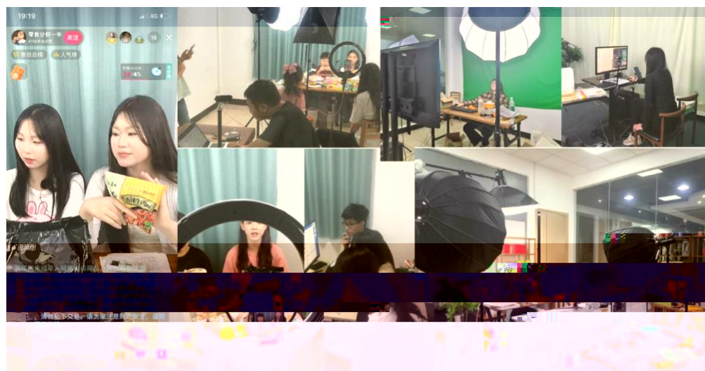
图 组织学生开展实习实训